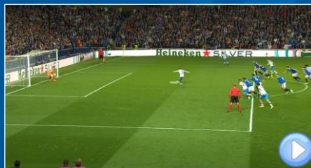
Se adelanta Atacante / No es Gol Si influye en la jugada: Tiro Libre Indirecto