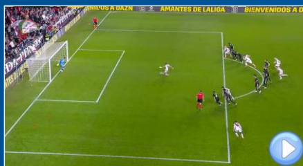
Se adelanta Defensor / No es Gol Si influye en la jugada: se repite el lanzamiento

Se penalizará el adelantamiento de los jugadores únicamente si tiene consecuencias/influencia en la jugada (el mismo concepto que en el caso del adelantamiento de los guardametas)