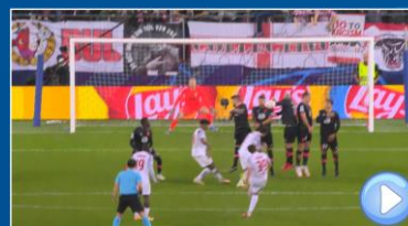
Mano Involuntaria Bloqueo-antinatural