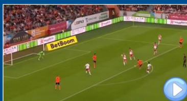
Mano Involuntaria Bloqueo-antinatural