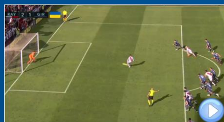
Se adelanta Atacante y Defensor / No es Gol Si influyen en la jugada: se repite el lanzamiento