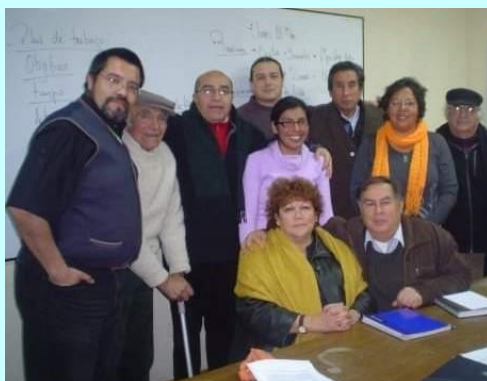
2008 Reunión de dirigentes para el primer encuentro de usuarios

El 2019 se comenzó a articular el VI congreso en Valparaíso, que se realizó de manera absolutamente autogestionada, desde los territorios, con temas propios, metodología, congregando a más de 4000 dirigentes a lo largo del país.