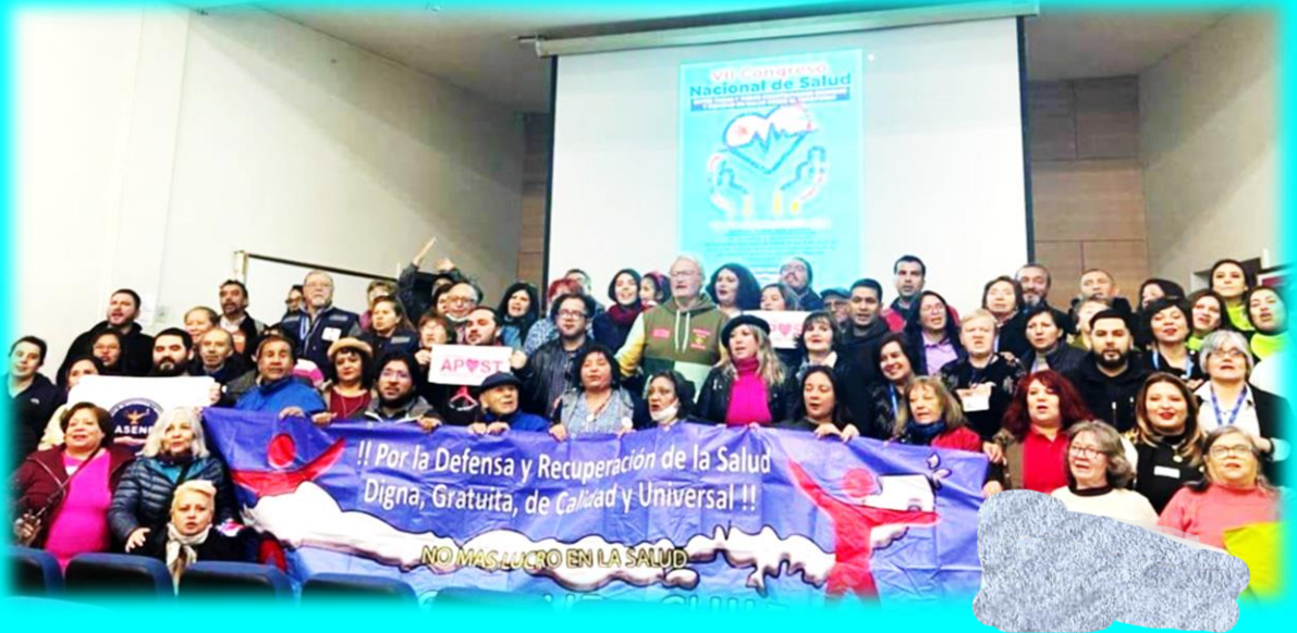
INAUGURACIÓN VII CONGRESO . 4 DE JULIO 2023. UNIVERSIDAD DE CHILE, FACULTAD DE MEDICINA.