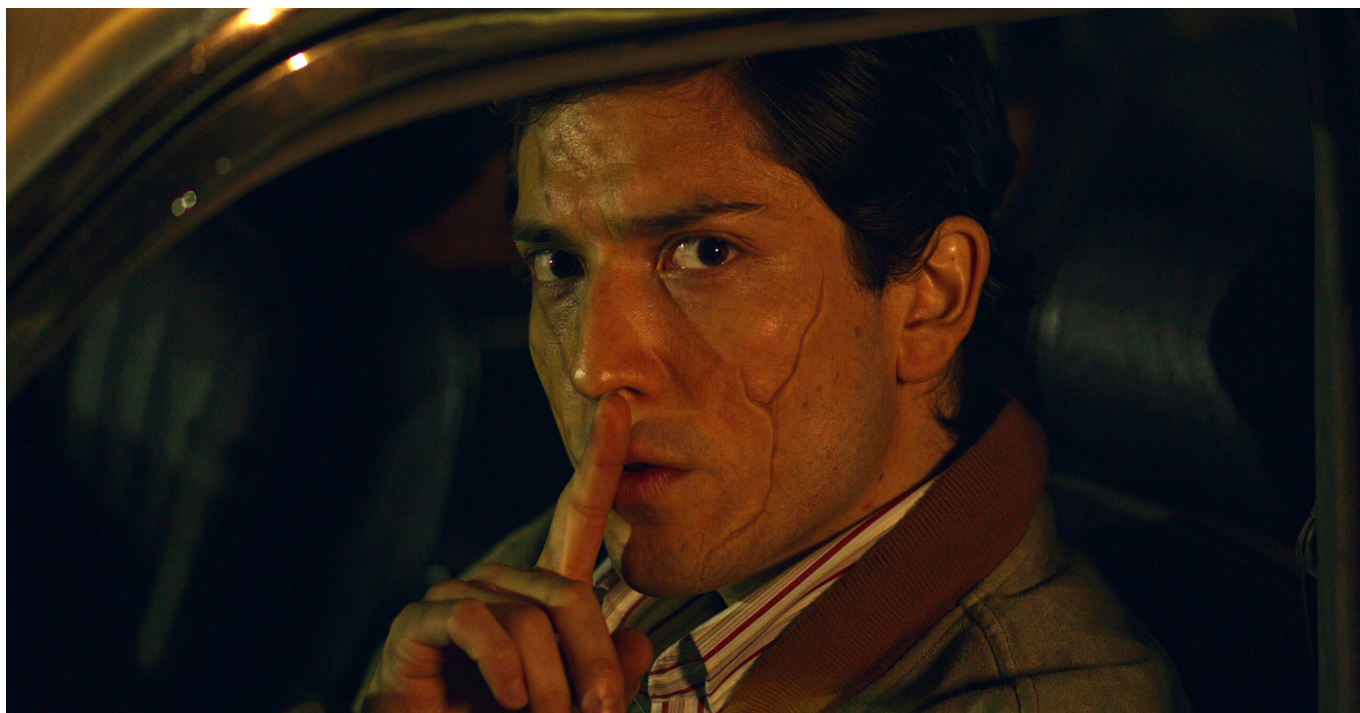
Fotografía de “Patio de Chacales”

de unos oscuros vecinos, quienes convierten su vida en una pesadilla que dejará cicatrices por décadas.