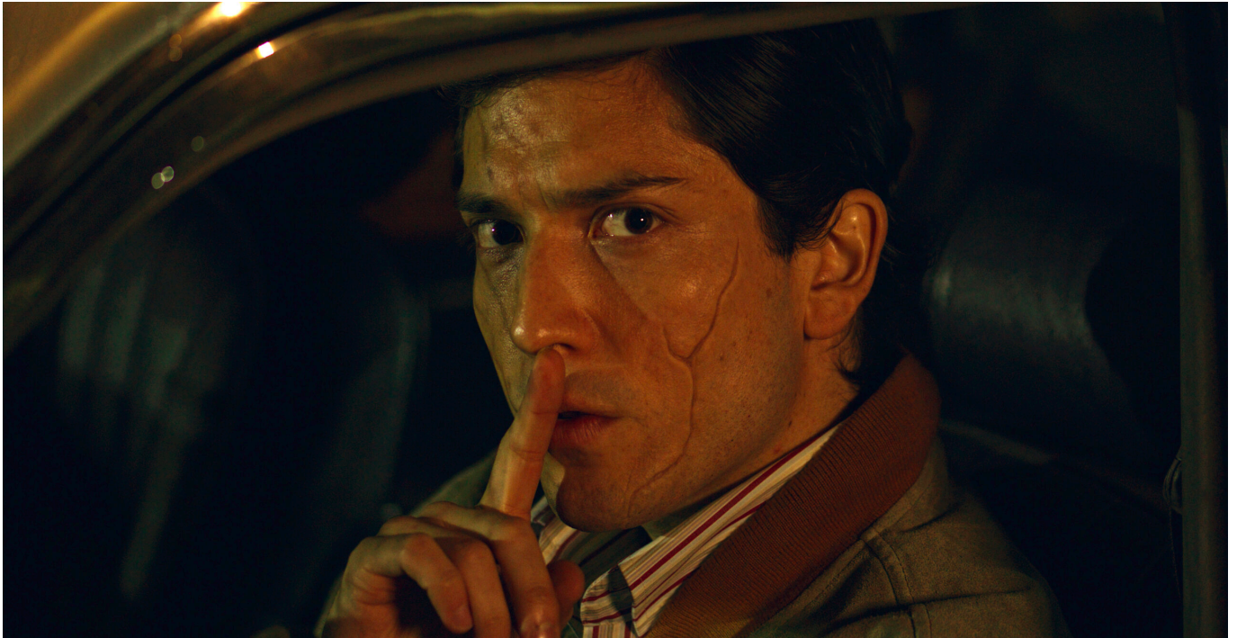
Fotografía de “Patio de Chacales”

de unos oscuros vecinos, quienes convierten su vida en una pesadilla que dejará cicatrices por décadas.