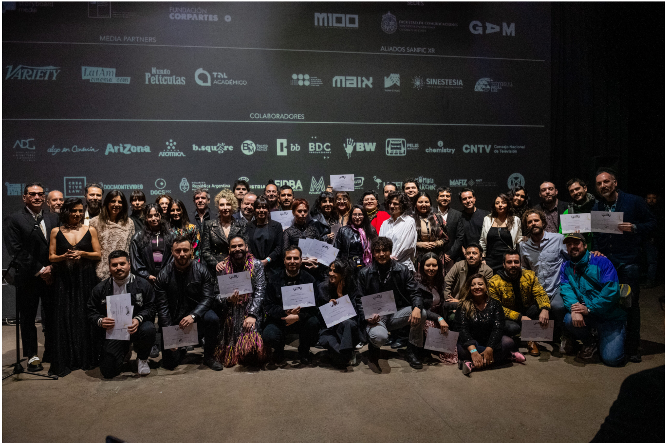
Fotografía de Clausura de SANFIC

Mórbido Lab podrán acceder al mercado online de FILMARKET HUB a través de una invitación exclusiva (valorada en 399 euros por proyecto) gracias a la alianza entre SANFIC INDUSTRIA y Filmarket HUB.